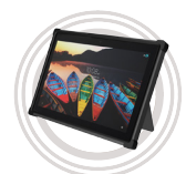
Boîtier résistant aux chocs