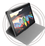
Cover a portafoglio