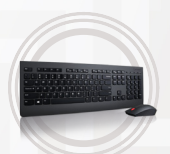
Ensemble clavier et souris sans fil Lenovo Professional