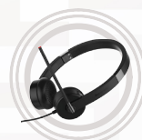
Casque stéréo Lenovo