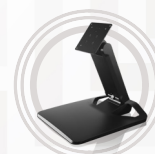
Support universel pour tout-en-un Lenovo