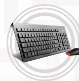
Lenovo Essential kabelgebundene Tastatur- und Mauskombination