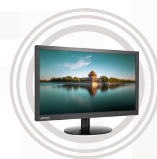
Lenovo LI2224 Monitor