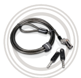
Câble de sécurité Kensington® MicroSaver® DS par Lenovo™ Mise en place facile, très efficace contre le vol