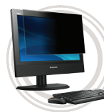
Filtre de confidentialité 3M pour moniteur Films antireflets assurant une protection contre les regards indiscrets