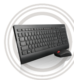
Clavier et souris sans fil Lenovo™ UltraSlim Vitesse et fluidité