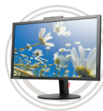
ThinkVision® Série T Tout pour le multimédia !