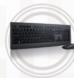
Ensemble clavier et souris sans fil Lenovo Professional