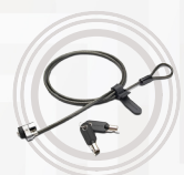
Câble de sécurité Kensington® double tête par Lenovo™

1 Selon l'étude de TBR portant sur les taux de réparation en grande entreprise (2011). 2 Hors socket du CPU.