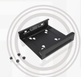
ThinkCentre Tiny VESA-Halterung II