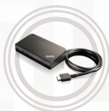
Station d'accueil USB 3.0 ThinkPad® Pro Dock