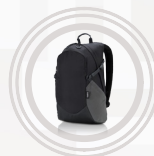
Sac à dos ThinkPad Active