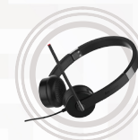
Casque stéréo 3,5 mm Lenovo