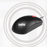
Souris de voyage USB ThinkPad