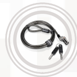
Câble de sécurité MicroSaver DS