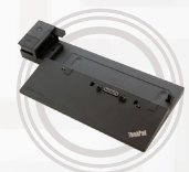
Station d'accueil ThinkPad Ultra Dock