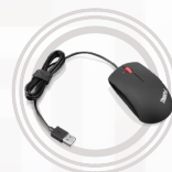
Souris USB ThinkPad Precision