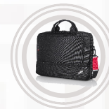
Sacoche à ouverture supérieure ThinkPad Essential