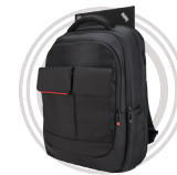
Sac à dos ThinkPad® Professional (jusqu'à 15,6")