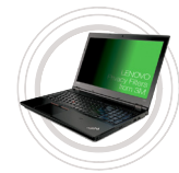
3M™ Blickschutzfilter von Lenovo™