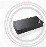
Estación de acoplamiento ThinkPad Thunderbolt