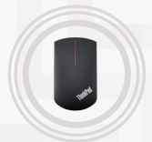
Ratón de precisión inalámbrico ThinkPad