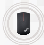
Mouse wireless ThinkPad Precision