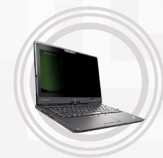
Filtro de privacidad