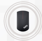
Ratón de precisión inalámbrico ThinkPad