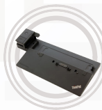
Estación de acoplamiento ThinkPad Ultra Dock