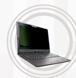
Filtre de confidentialité