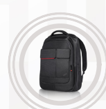
Sac à dos ThinkPad Professional