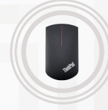
Souris sans fil ThinkPad Precision