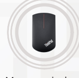
Mouse wireless ThinkPad Precision