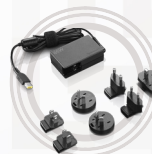
Adaptador de CA de viaje de Lenovo de 65 W