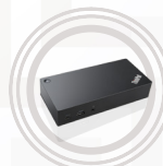
Station d'accueil USB Type-C ThinkPad