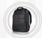
Sac à dos ThinkPad Professional