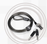
Cavo di sicurezza Microsaver DS