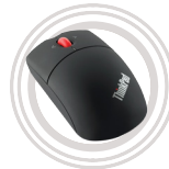
Ratón inalámbrico láser con Bluetooth®