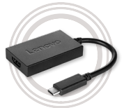
Adaptador de USB Tipo C a HDMI™ de Lenovo™