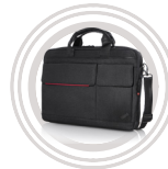
Sac à dos ThinkPad® Professional