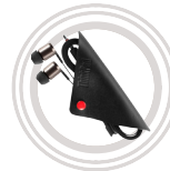
Écouteurs intra-auriculaires à filtrage de bruit ThinkPad®