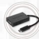
Adaptateur USB Type-C vers VGA Lenovo