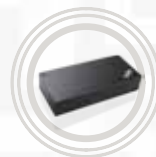
Station d'accueil USB Type-C ThinkPad