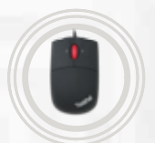
Souris laser USB ThinkPad