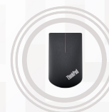
Ratón táctil inalámbrico ThinkPad X1