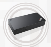
Estación de acoplamiento ThinkPad Thunderbolt 3