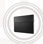
Housse ThinkPad X1 Ultra