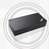
Station d'accueil Thunderbolt 3 ThinkPad