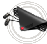
Auricolari per ThinkPad® X1

Una speciale soluzione di docking per ThinkPad®