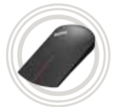
Mouse touch wireless per ThinkPad® X1

Connessioni wireless ed espansione delle funzionalità del dispositivo