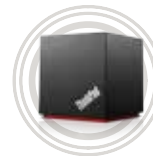
Dock WiGig per ThinkPad®

Eccezionale qualità del suono e massimo comfort