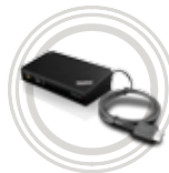
Dock OneLink Pro per ThinkPad®

Una speciale soluzione di docking per ThinkPad®