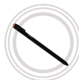
Stylet numérique Très grande précision d'écriture