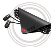
Écouteurs intra-auriculaires pour ThinkPad® X1 Qualité sonore remarquable et grand confort d'utilisation