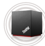
Station d'accueil WiGig ThinkPad® Connectez-vous sans fil et étendez les fonctionnalités de votre appareil