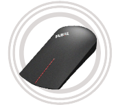
Souris tactile sans fil pour ThinkPad® X1 Deux modes d'utilisation (pointage et présentation)