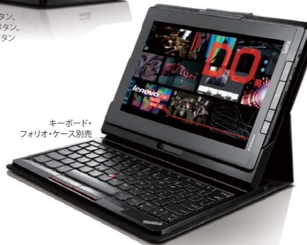
キーボード・ フォリオ・ケース別売