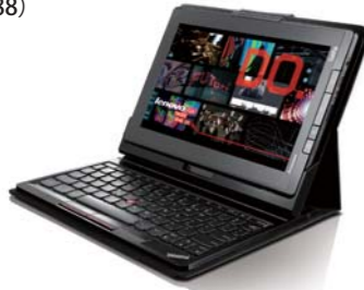
ThinkPad Tablet キーボード・フォリオ・ケース (0A36388)

レーザー素材のThinkPadキーボード・フォリオ・ケースは、キーボードとしても、タブレットのケースとしてもお使いいただけるオプション製品です。3パターンの位置調整ができるマグネット式スタンドや、光学トラックポイントが搭載されており、情報入力をより効率良く行うことができます。