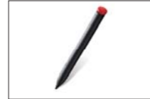
ThinkPad Tablet ペン (0A33887)

ThinkPad Tabletドックは、人体工学に基づき、縦型で画面内の文字を読む際に最適な位置でタブレットをホールドすることができるオプション製品です。急速充電が可能な65WのACアダプターを同梱しており、インターフェースにはUSB2.0ポート、マイクロUSBポート、ステレオ出力、マイク入力が搭載されています。