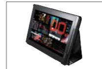
ThinkPad Tablet フォリオ・ケース (0A36405)