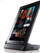
ThinkPad Tablet ドック (0A33956)

ThinkPad Tabletドックは、人体工学に基づき、縦型で画面内の文字を読む際に最適な位置でタブレットをホールドすることができるオプション製品です。急速充電が可能な65WのACアダプターを同梱しており、インターフェースにはUSB2.0ポート、マイクロUSBポート、ステレオ出力、マイク入力が搭載されています。