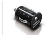
ThinkPad Tablet DCチャージャー (0A36247)