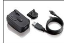
ThinkPad Tablet ACチャージャー (0A36248)