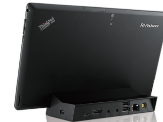
ThinkPad Tablet 2 ドック (OB47112)

オフィスで使用される事を想定し、イーサネットのポートを装備しています。ThinkPad Tablet 2をドックに装着していただく事で無線環境がない環境でもご利用いただけます。また、ドックにはUSB2.0×3、HDMI×1、ThinkPad Tablet 2をすばやく充電できるThinkPad 65W ACアダプター同梱しています。