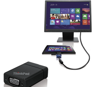
ThinkPad Tablet 2 VGAアダプター (OB47084)

オフィスで使用される事を想定し、イーサネットのポートを装備しています。ThinkPad Tablet 2をドックに装着していただく事で無線環境がない環境でもご利用いただけます。また、ドックにはUSB2.0×3、HDMI×1、ThinkPad Tablet 2をすばやく充電できるThinkPad 65W ACアダプター同梱しています。