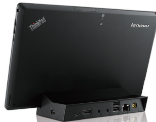
ThinkPad Tablet 2 ドック (0B47112)

オフィスで使用される事を想定し、イーサネットのポートを装備しています。ThinkPad Tablet 2をドックに装着していただく事で無線環境がない環境でもご利用いただけます。また、ドックにはUSB2.0×3、HDMI×1、ThinkPad Tablet 2をすばやく充電できるThinkPad 65W ACアダプター同梱しています。