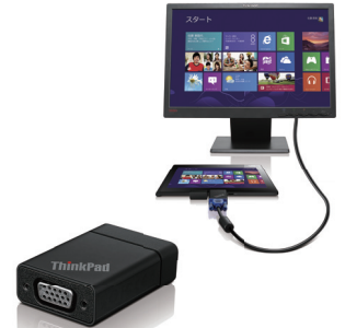
ThinkPad Tablet 2 VGAアダプター (0B47084)

オフィスで使用される事を想定し、イーサネットのポートを装備しています。ThinkPad Tablet 2をドックに装着していただく事で無線環境がない環境でもご利用いただけます。また、ドックにはUSB2.0×3、HDMI×1、ThinkPad Tablet 2をすばやく充電できるThinkPad 65W ACアダプター同梱しています。