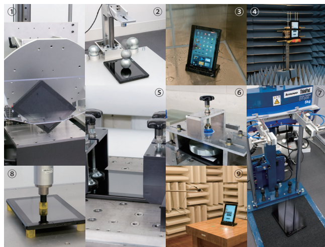
①角落下試験 ②液晶面鉄球落下試験 ③防滴試験 ④無線性能試験 ⑤反復繰り返し衝撃試験 ⑥加圧振動試験 ⑦自由落下試験 ⑧LCDストレステスト ⑨動作ノイズ測定試験

※テストの内容は設計・開発上の耐久基準として定めているもので、同条件下での個々の製品の耐久性を保証するものではありません。