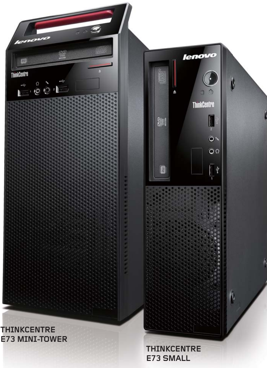
THINKCENTRE E73 MINI-TOWER

第4世代インテル® Core™ プロセッサ・ファミリー搭載。 優れた使い勝手とコストパフォーマンスを兼ね備え、 デザイン性を追求したスタイリッシュなデスクトップPC。