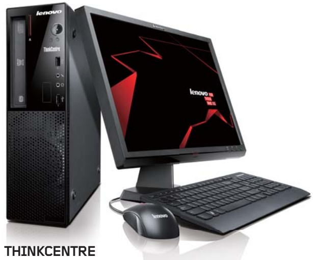
THINKCENTRE E73 SMALL