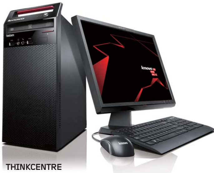
THINKCENTRE E73 MINI-TOWER

スタイリッシュなボディーに、最新プロセッサを搭載したThinkCentre E73シリーズ。小規模なオフィスやスモールビジネスに最適化したスタンダード・デスクトップPCです。人間工学に基づいた使いやすい筐体設計、Thinkブランドならではの信頼性と耐久性、そしてビジネスでの利用において欠かせない、高いセキュリティー機能も備えています。モデルは、拡張性に優れたMini-TowerとコンパクトなSmallの2つから選択可能。用途やオフィス環境に応じて自由に選ぶことができ、教務効率化、生産性向上に貢献します。