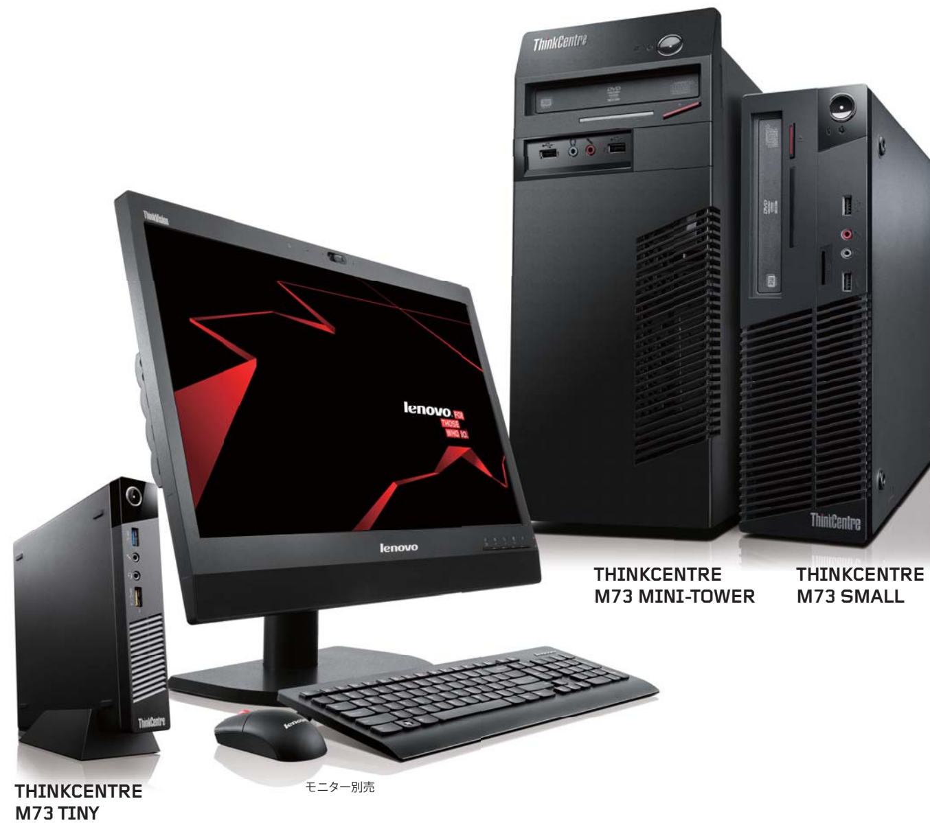
THINKCENTRE M73 MINI-TOWER

第4世代インテル® Core™ プロセッサ・ファミリー搭載。オフィスに合わせて3つのボディーサイズから選択できる充実の機能を備えたスタンダード・デスクトップPC。