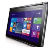
タブレットモード