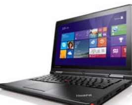
ラップトップモード