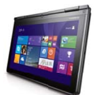
タブレットモード