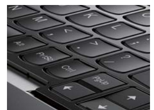
キーロックされた状態