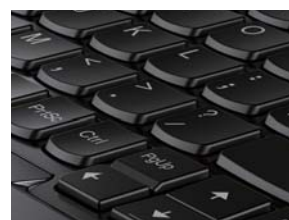
キーロックされていない状態

スロープ形状のキートップ表面により、指に吸い付くような快適な操作感を提供するバックライト付きキーボードを搭載。ソフト・ランディング(軟着地)にチューニングされたキータッチなど、長時間の利用でも疲れにくい工夫が施されています。またタブレットモードにすると、キーボード面のフレームが上昇し、キーをロック。持ちやすくなるとともに、誤ってキーを押すことがありません。各モードでのユーザビリティを考慮した設計です。