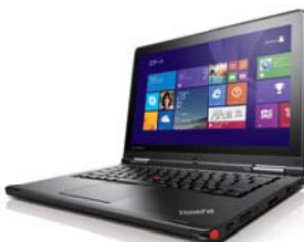
ラップトップモード