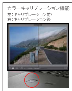
カラーキャリブレーション機能 左:キャリブレーション前/ 右:キャリブレーション後