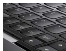
キーロックされた状態

タブレットモードにすると、キーボード面のフレームが上昇し、キーをロック。持ちやすくなるとともに、誤ってキーを押すことがありません。各モードでのユーザビリティを考慮した設計です。