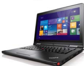
ラップトップモード