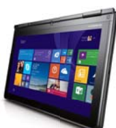
タブレットモード