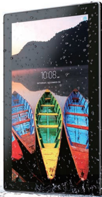
※写真は実物と異なる場合がございます。