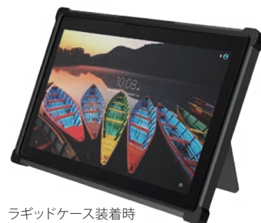
ラギッドケース装着時