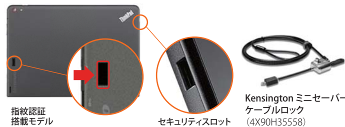
指紋認証搭載モデル セキュリティスロット Kensington ミニセーバー ケーブルロック (4X90H35558)

指紋認証搭載モデルもラインアップし、企業向けのセキュリティに対応しているので、ビジネスに最適です。タブレットの物理的なセキュリティ対策として、新たにThinkPad 10本体側面のセキュリティ キーホールに施錠可能な「Kensington ミニセーバー ケーブルロック」をご用意するとともに、上下左右、4方向からのディスプレイの覗き込みを防止する、「ThinkPad 10プライバシーフィルター (4方向)」をご利用頂けます。