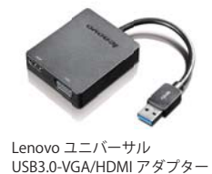
Lenovo ユニバーサル USB3.0-VGA/HDMI アダプター

Lenovo Micro HDMI - VGA アダプター (4X90H55731)、Lenovo Micro HDMI - HDMI アダプター (4X90G35035)、Lenovo ユニバーサル USB3.0-VGA/HDMIアダプター (4X90H20061)と豊富なディスプレイ出力アダプターを取り揃えており、訪問先のようなディスプレイでThinkPad 10を使用時のプレゼンテーションやデータの表示が可能となっています。