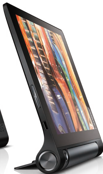
YOGA Tab 3 8