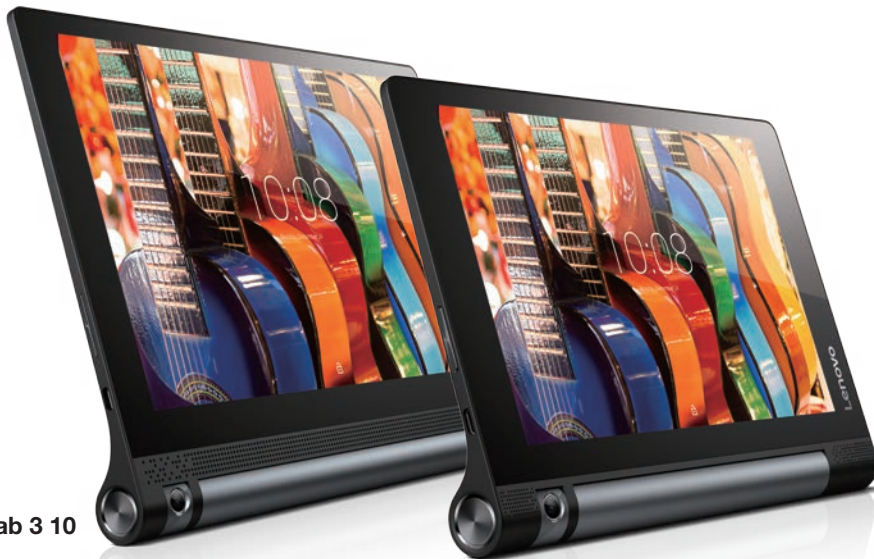
YOGA Tab 3 10