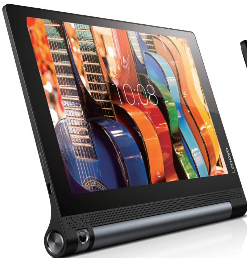
YOGA Tab 3 10