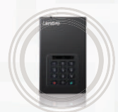
HD Protegido para Desktop Lenovo™