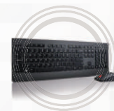
Teclado e Mouse Profissionais Wireless Lenovo™