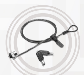
Trava Dupla Kensington® para a Lenovo™