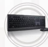
Teclado e Mouse Profissionais Sem Fio Lenovo™