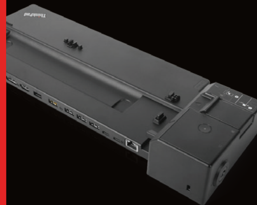
◀ Dock ThinkPad® Ultra