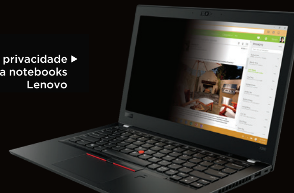
Filtro de privacidade 3M para notebooks Lenovo