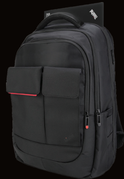
Mochila ThinkPad® Professional