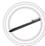
Lenovo Active Pen 2