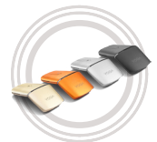
Lenovo Yoga™ Maus

* Beispiel für die Namenskonvention im Lenovo Miix-Katalog