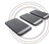
Lenovo USB-C SSD