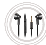
Auricolari Lenovo 500 Extra Bass*