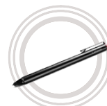
Lenovo Active Pen*