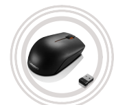
Mouse wireless Lenovo 300*