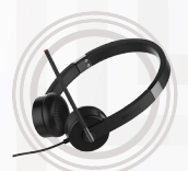
Casque stéréo Lenovo