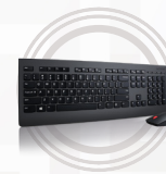
Ensemble clavier et souris sans fil Lenovo Professional