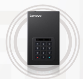
Disque dur sécurisé Lenovo pour ordinateur de bureau