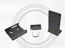
ThinkCentre Tiny VESA-Halterung