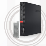
ThinkCentre 1L Tiny Staubschutz