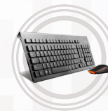
Combinazione wireless Lenovo Professional