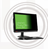
Lenovo Privacy Filter per All-In-One ThinkCentre di 3M