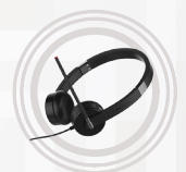
Cuffie stereo Lenovo