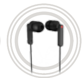
Écouteurs intra-auriculaires ThinkPad®

Aussi génial au bureau que dans votre vie personnelle hyperactive.