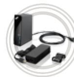
Station d'accueil ThinkPad® OneLink Pro

OneLink : un seul câble pour tout connecter.