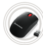
Souris optique sans fil ThinkPad®