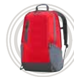
Sac à dos ThinkPad® Active

OneLink : un seul câble pour tout connecter.