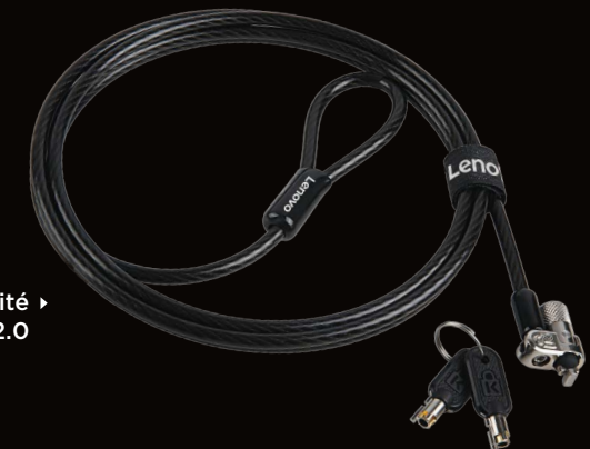
▶ Câble de sécurité Kensington MicroSaver 2.0