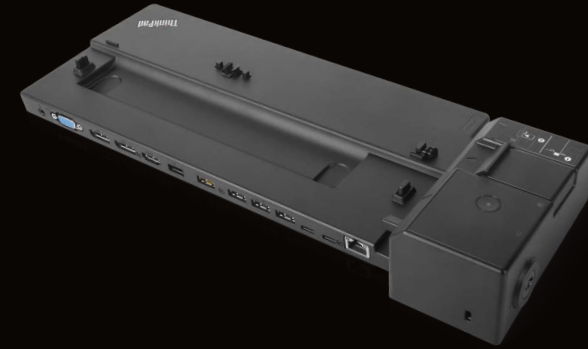
Station d'accueil Think- Pad Ultra Dock (135 W)