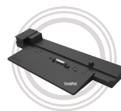
Estación de acoplamiento con la tecnología de rendimiento ThinkPad®